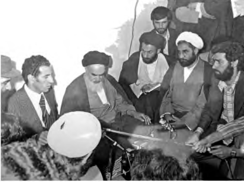
مؤتمر صحفي يجمع عبد السلام جلود بالمرشد الأعلى للثورة الإيرانية الإمام روح الله الخميني أثناء زيارته لإيران، 1979.